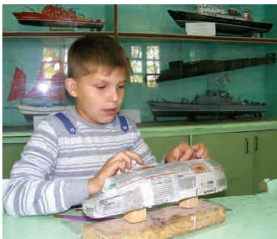
Мальчишкам интересен и сам процесс создания модели морского судна, и ее ходовые качества. На «верфи» в ЦДТ юные конструкторы собирают миниатюрные военные и гражданские суда, подводные лодки и старинные парусники, которые затем участвуют в различного уровня соревнованиях по судомоделированию.

Судомоделирование некоторые считают пустой тратой времени или занятием для тех, кому делать нечего. Но вряд ли найдется человек, который не обрадовался бы подаренной модели фрегата или бригаанты. Многие корабли, модели которых сегодня мы можем поддержать в руках, уже