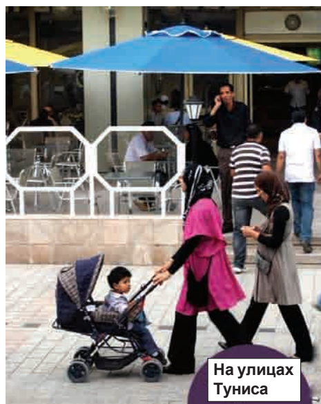
На улицах Туниса

Трудоустройство после получения диплома — личное дело выпускника. Но проблема эта очень серьезная, потому что уровень безработицы в Тунисе составляет около 25%. Поэтому около 700 тысяч тунисцев (двенадцатая часть населения) живут и работают за пределами страны.