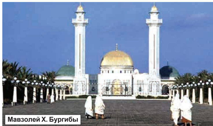
Мавзолей Х. Бургибы

Из 12 месяцев, что нужно отдать Родине, призывник три первых месяца усердно занимается физической подготовкой, а оставшиеся девять трудится по своей гражданской профессии — врачом, строителем, хлебопеком и т.д. Словом, государство таким образом находит бесплатную рабочую силу и одновременно на год решает проблему трудоустройства молодого человека.