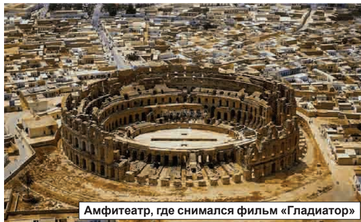
Амфитеатр, где снимался фильм «Гладиатор»